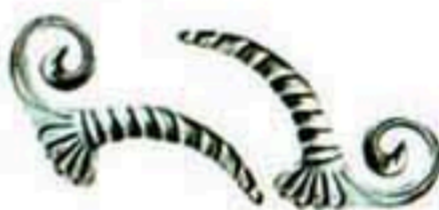
31043(小) 31044(小) W*H=130*210 78元/只 78元/只