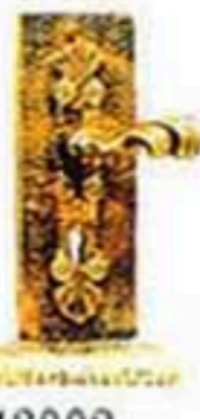
43002 鍛打把手 (不含鎖及展示座) W*H=180*270 1500元/只