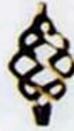
23011 □ 16*16 W*H=68*145 85元/只