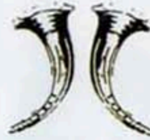
21016 21017 (鍛打) (鍛打) W*H=110*260 400元/只 400元/只