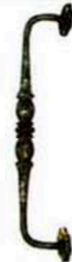
FW-1513 W*H=75*440 700元/只