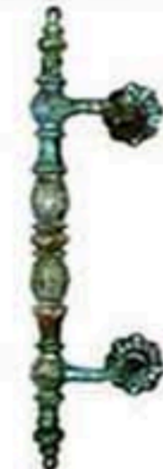
FW-1515 W*H=70*440 1100元/只