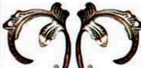
31065 31066 W*H=130*160 90元/只 90元/只