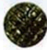
32308 元扣 23 17 15元/只 12元/只 (大) (小)