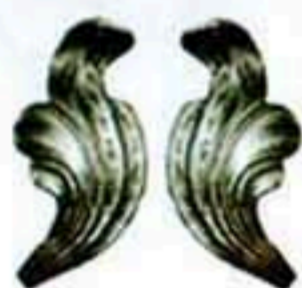
31035 31036 W*H=65*120 33元/只 33元/只