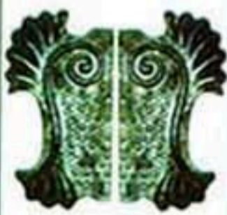
41001 左 右 W*H=160*290 350元/只 350元/只