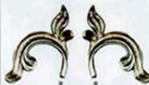
31029 31030 W*H=130*120 60元/只 60元/只