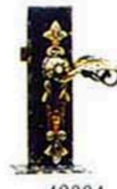
43004 銅把手(B) (不含鎖及展示座) W*H=150*250 1500元/只