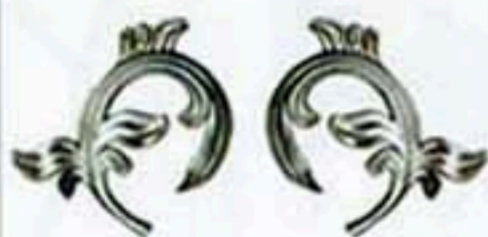
31017 31018 W*H=180*150 130元/只 130元/只