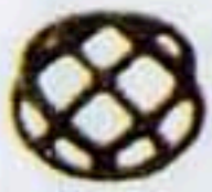
23003 □ 20*20 W*H=75*75 60元/只