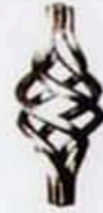
FW-1140 □ 24*24 W*H=110*250 450元/只