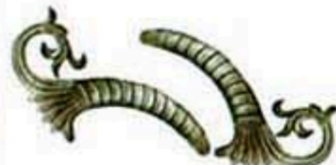
31045(大) 31046(大) W*H=210*340 255元/只 255元/只