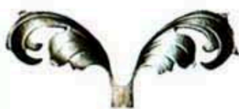
31067 W*H=240*100 120元/只