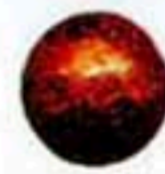
32307(鍛打鐵珠) 16 19 8元/只 12元/只 25 38 40元/只 65元/只