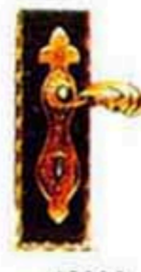
43003 銅把手(A)(大公維) (含鎖) W*H=150*250 3750元/只