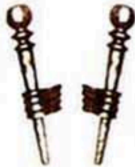
42007 左 右 1500元/只 1500元/只