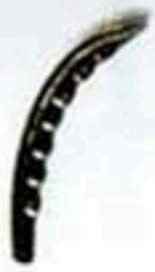
FW-1154 (鍛打) W*H=115*145 30元/只