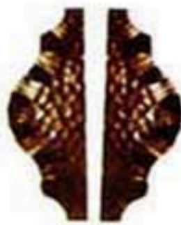
41005 左 右 W*H=140*390 300元/只 300元/只