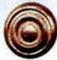
32305 鍛打捲餅 39 45元/只