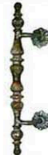
FW-1514 W*H=70*410 1000元/只